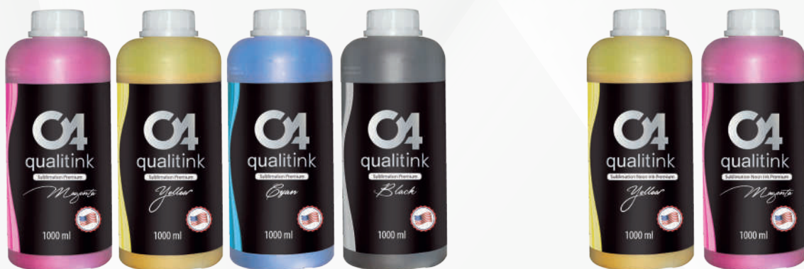
• Premium CMYK